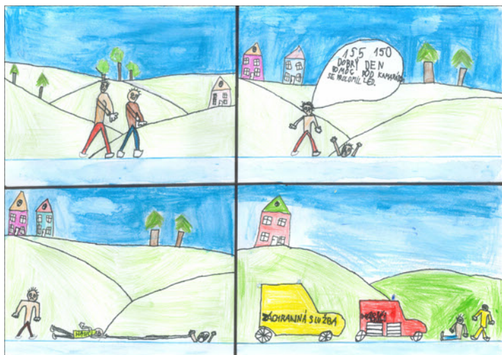
Autoři: Štěpán Bláha